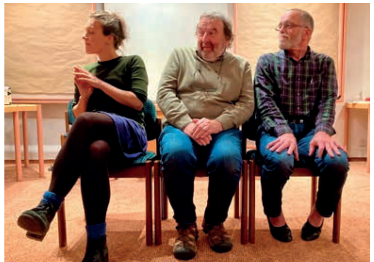
Am Abend versuchen drei Clowns zu flirten, aber jeden Blickkontakt unbedingt zu vermeiden.

https://biodynamische-ausbildung.de/region-sueden/ausbildungsinitiativkreis , der Einladung zur Klausur und dem Protokoll von Laura Fetzer zusammengestellt von Rudolf Mehl