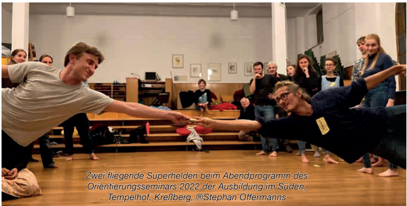
Zwei fliegende Superhelden beim Abendprogramm des Orientierungsseminars 2022 der Ausbildung im Süden, Tempelhof, Kreßberg, ©Stephan Offermanns