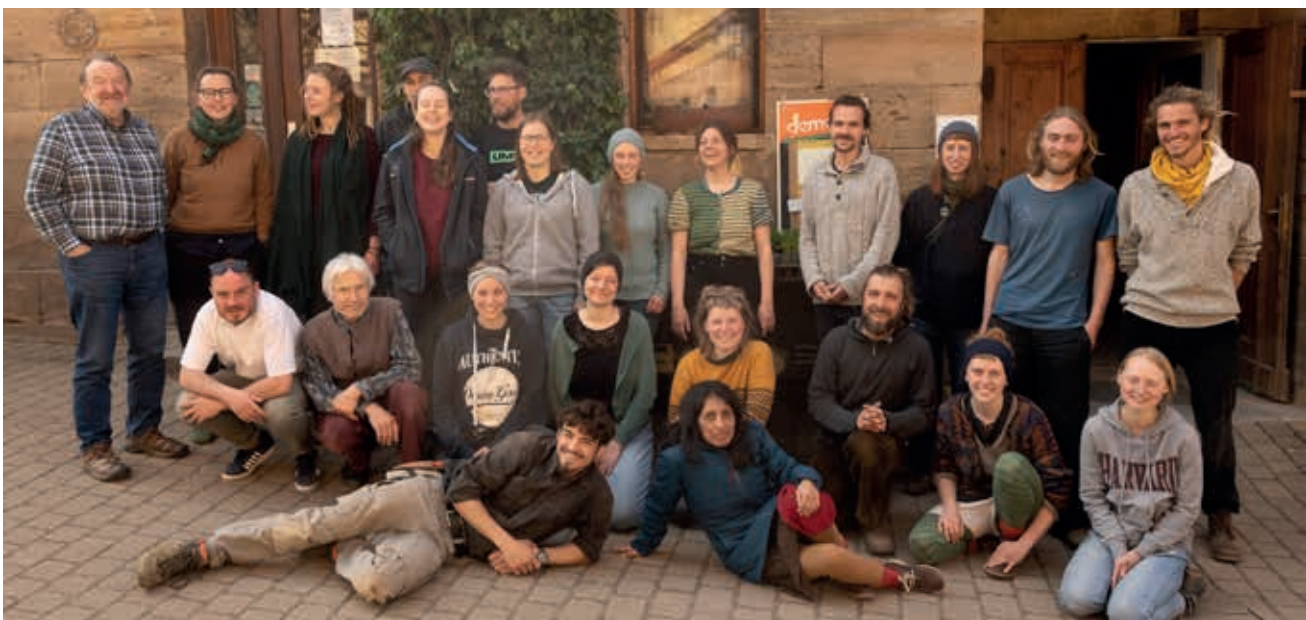
Willkommensseminar in Wernstein im März 2022