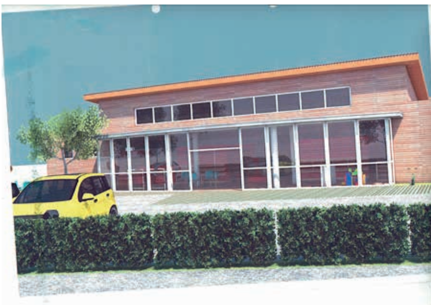
Entwurf möglicher Hofladen