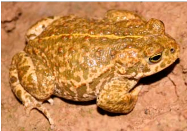
Ausgewachsene Kreuzkröte im August 2010, aufgenommen auf einer Ackerfläche zwischen Binzen und Fischingen

Steckbrief der Kreuzkröte: 5 – 8 cm lang, Oberseite braun-olivgrün marmoriert mit zahlreichen oft rötlichen Warzen. Typisch: gelbe Längslinie über den Rücken. Pupille waagrecht mit gelbgrüner Iris. Männchen mit kehlständiger Schallblase.