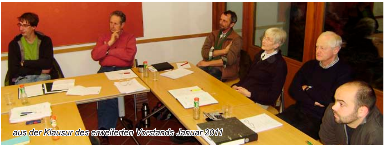
aus der Klausur des erweiterten Vorstands Januar 2011