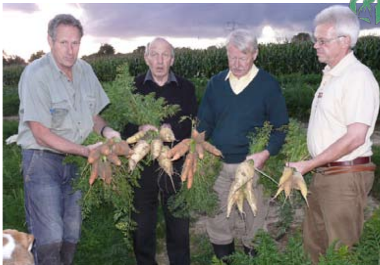
Ein Teil des Wirtschaftskreises bei der Felderbegehung