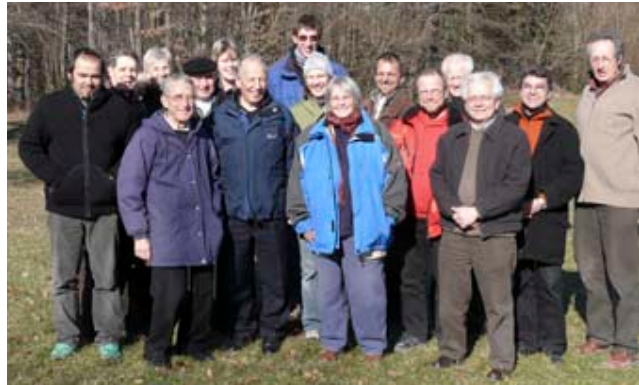
Der Initiativkreis bei der Klausur

feinster Verteilung angewendet. Sie haben nun die Kraft, wie eine Art homöopathische Medizin, das Erdreich im Acker gründlich zu beleben.