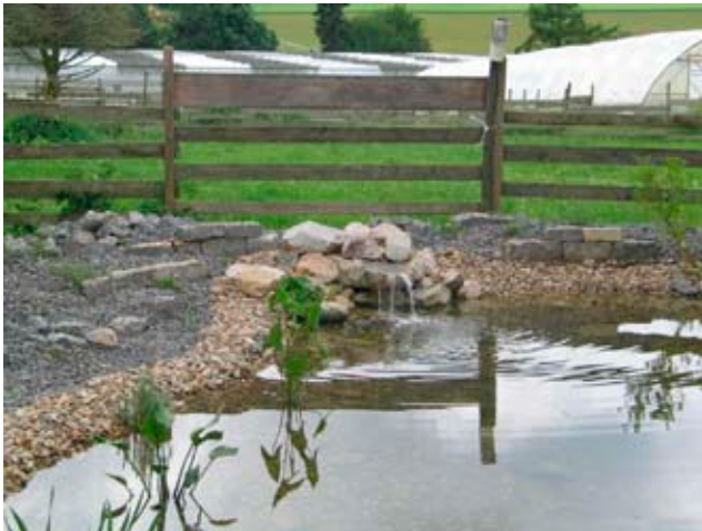
Neues Wasserbecken in Vaihingen zur Entspannung